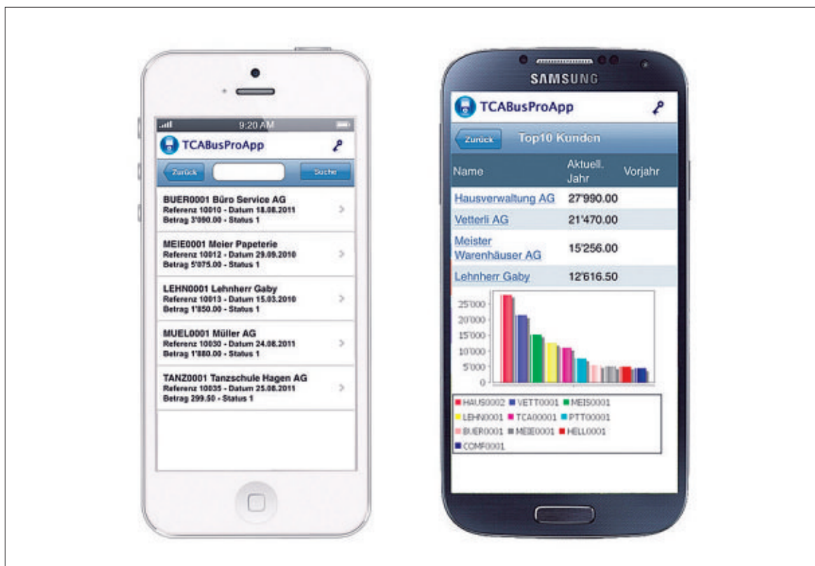
Das Büro auch unterwegs und sicher mit dabei: Die TCA BusPro Apps bieten erschwingliche und praktische Lösungen für KMU.

BusPro AG , buspro@buspro.ch , www.buspro.ch , T: 052 213 72 00, F: 052 213 72 07