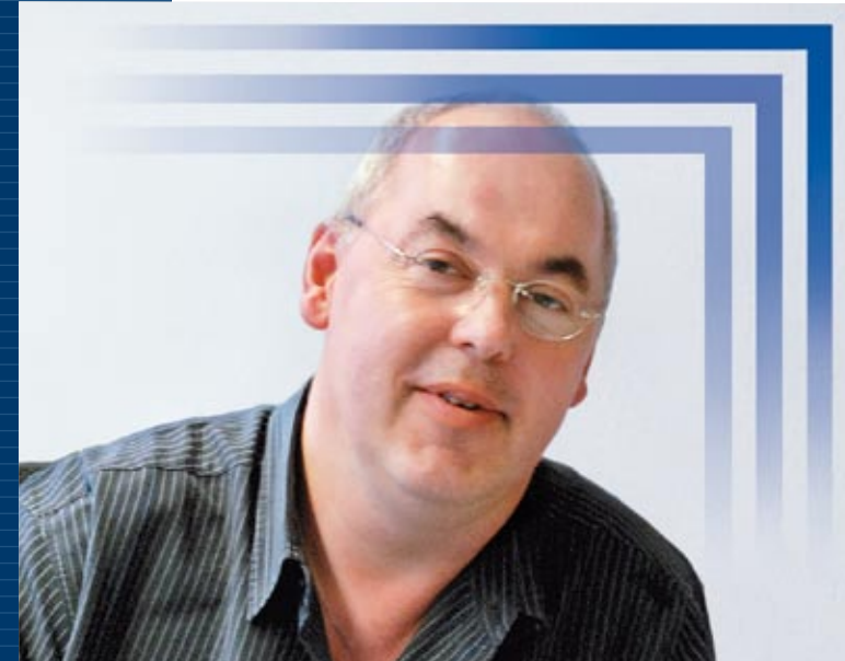
Marco Roskamp Glametec GmbH

KMU-Unternehmen empfehlen BusPro. Zum Beispiel die Glametec GmbH.